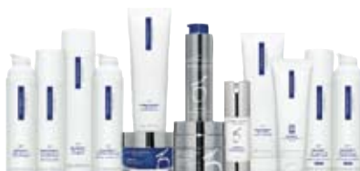
※メディカルコスメイメージ

※診察の結果によりオリジナルプログラムを組みます。 ※診察が必要ですので一度ご来院ください。